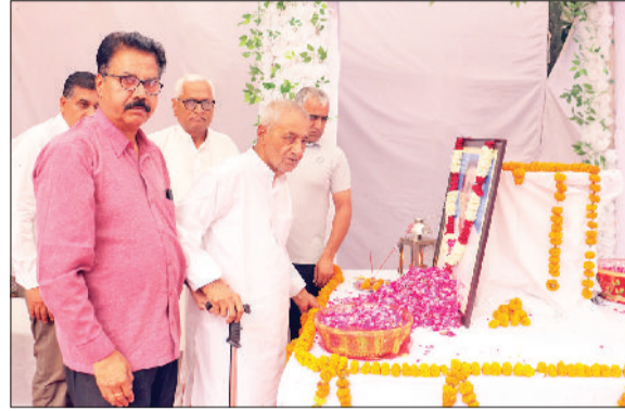
भिवानी। पुष्प अर्पित करते हुए।