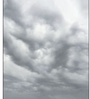
मिवानी। आसमान में छाप काले बादलों का दृश्य।

मंगलवार को मौसम का पल पल मिजाज बदलता रहा। हालांकि मिवानी में तेज बारिश नहीं आई, लेकिन बार बार फुव्वारों ने पारे को पुंर तोड़े रखा। पारा 31 डिग्री सेल्सियस से उतर नहीं जा सका। दिनभर मौसम सुहाना बना रहा। सुबह जब लोग सांकर उठे तो उस वक्त आसमान में काले बादल छाए हुए थे। कुछ देर बाद तेज हवा के साथ हलकी फुव्वारें गिरनी शुरू हो गईं। लोगों को लगा की तेज बारिश आएगी, लेकिन कुछ देर बाद बूंदबांदी थम गई। उसके बाद मौसम में कई बार बदलाव आए। कभी फुव्वारें तो कभी हलकी बूंदबांदी ने लोगों की परेशानी बढ़ाए रखी। दूसरी तरफ तेज हवा चलने से खेतों