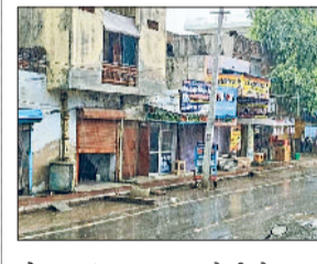
लोहार। शहर में बरसात के बाद तरबतर सड़के।

लोहार। मंगलवार सुबह से ही लोहार और आसपास के गांवों में ठक ठककर बरसात शुरू हो गई। लोहार शहर में बरसात के चलते सड़के पानी से तरबतर हो गईं, वहीं ग्रामीण इलाकों में हुई बारिश ने किसानों की परेशानी बढ़ा दी है। इलाके के साथ दिनांक के ग्रामीण क्षेत्रों में भी दोपहर को झमाझम बरसात हुई। किसानों ने कहा कि इलाके का किसान अपनी रबी सीजन की फसलों को समेटने में