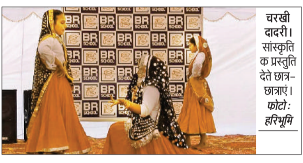
चरखी दादरी। सांस्कृतिक प्रस्तुति देते छात्र-छात्राएं।

बीआर संस्था द्वारा संचालित आईपीएस स्कूल बिरही कला में कक्षा नर्सरी से 11वीं तक के विद्यार्थियों के लिए वार्षिक परीक्षा परिणाम घोषणा एवं पुरस्कार वितरण समारोह का भव्य आयोजन किया गया। कार्यक्रम उत्साह, अनुशासन एवं अभिभावकों की गरिमामयी उपस्थिति के साथ सम्पन्न हुआ।