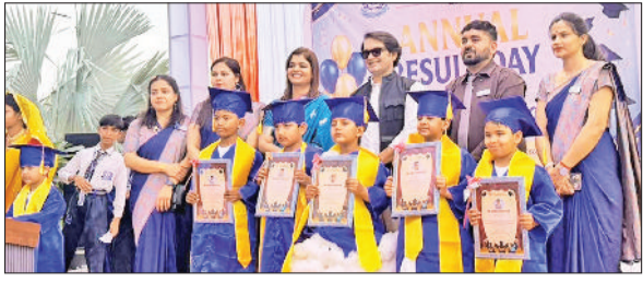
भिवानी। आयोजित कार्यक्रम में सम्मानित करते हुए।