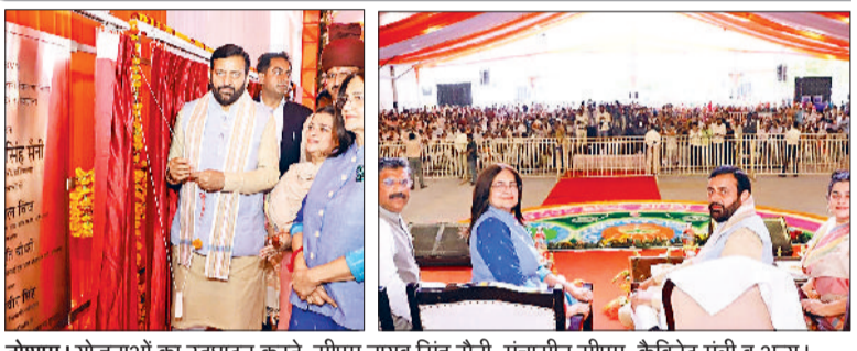
तोशाम। योजनाओं का उदघाटन करते सीएम नायब सिंह सैनी, मंचासीन सीएम, कैबिनेट मंत्री व अन्य।

तोशाम आईएमटी के लिए ई-मूमि पोर्टल को अगले सप्ताह में खोला जाएगा